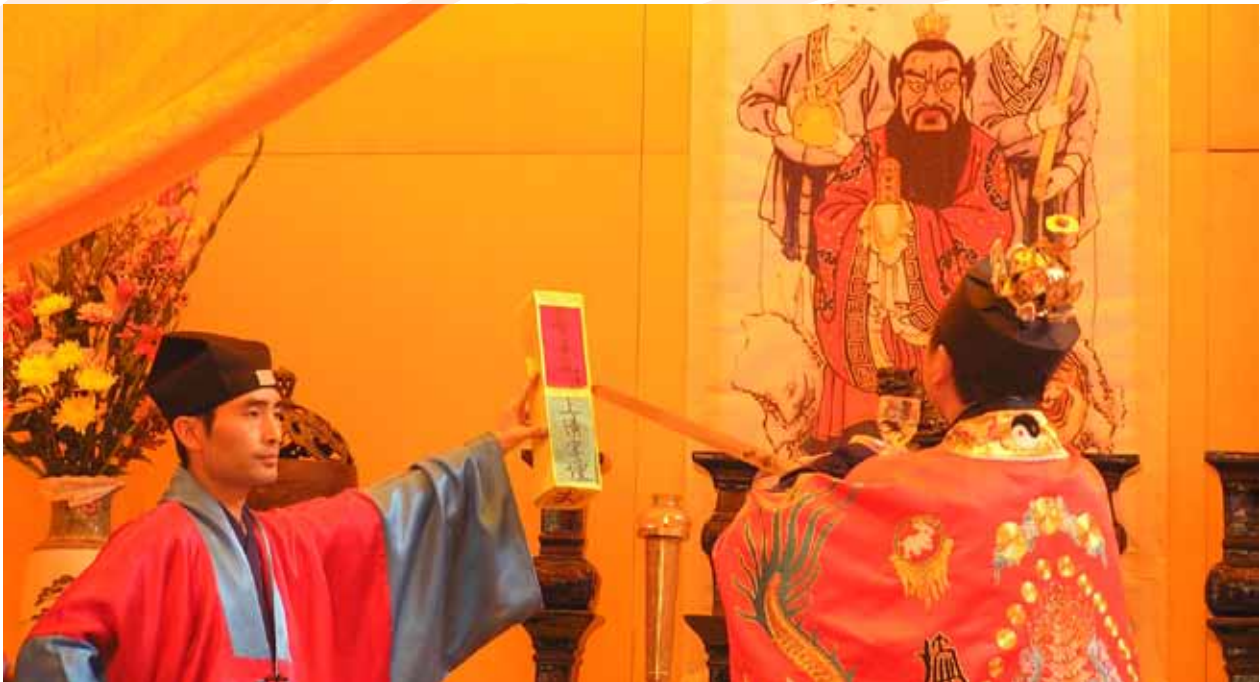
道教儀式的內涵已深入民間生活