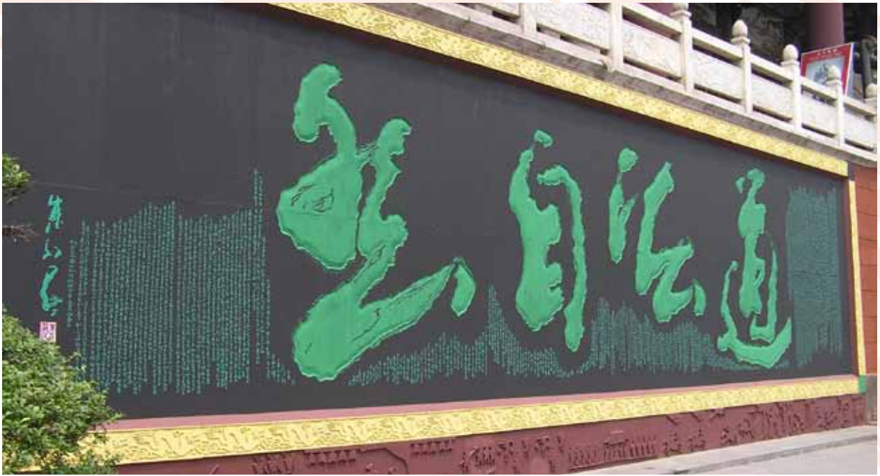
道教透過養生方式達到長生目標，建立「不死」的「養生」生命觀。

了佛教阿彌陀佛接引西方淨土、觀世音人間救苦、地藏菩薩地獄薦拔三種神格的綜合體，有這種神格相近的現象，可能是佛道相互沿承或影響的結果。