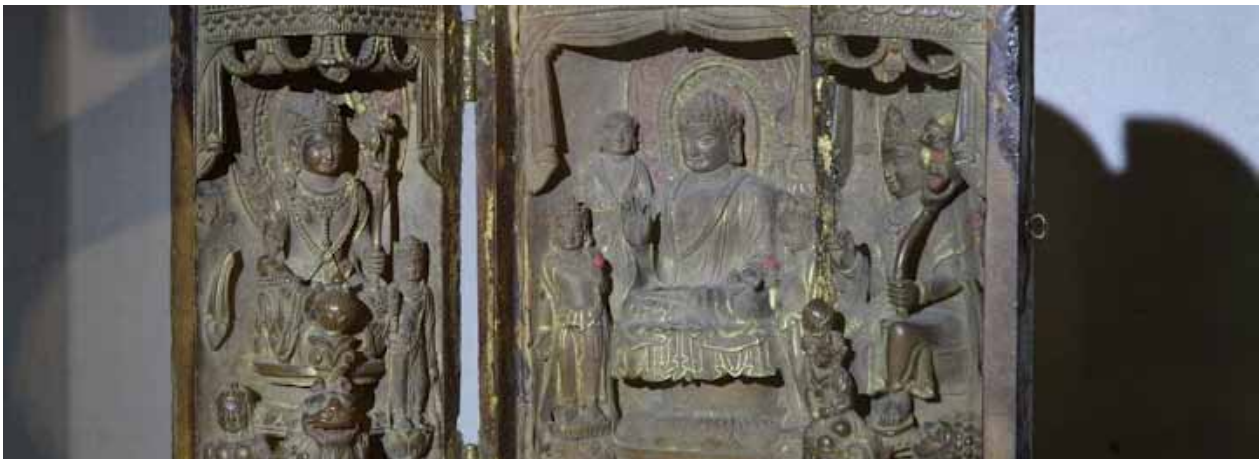
松廣寺的國寶第42號的木彫三尊佛龕，內刻有釋迦佛以及文殊、普賢二菩薩。

松廣寺還有另外兩座小型的傳統建築，雖然未被列入特殊的文物等級，卻十分耐人尋味。其中一座稱為「滌珠閣」，另一座稱為「洗月閣」。這兩座古樸的小屋具有特別的功能，它們是亡靈淨身之處。如果有家屬要請牌位至松廣寺安位或做佛事，亡靈在入寺之前必須先淨身，以表示對三寶的恭敬。而且亡靈有男女之分，故而淨身之地就分為二處，猶如男湯及女湯，很實際地反映出人們依據現世的寫照，而揣摩著對死後世界的想像。