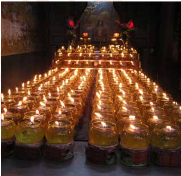
燈儀是道教科儀的一種，現已延伸點燈祈求光明之意。

早在漢代，《太平經》在命論思想、養生學、疾病觀與治療法、死後世界等有完整的觀點，對道教的生命觀產生重要的影響。《太平經》秉持道家的「重人貴生」的生命理念，認為「生」是「真道」的一種存在型態，也是其價值和意義的充分表現。強調在有形生命中，人的生命最珍貴，因其導源於天地，所以每個人都要負責任保養好自己的身體，始能盡天年，得道的人度己的同時也要能度人、度塵世，更有義務傳授真道、消彌苦難。