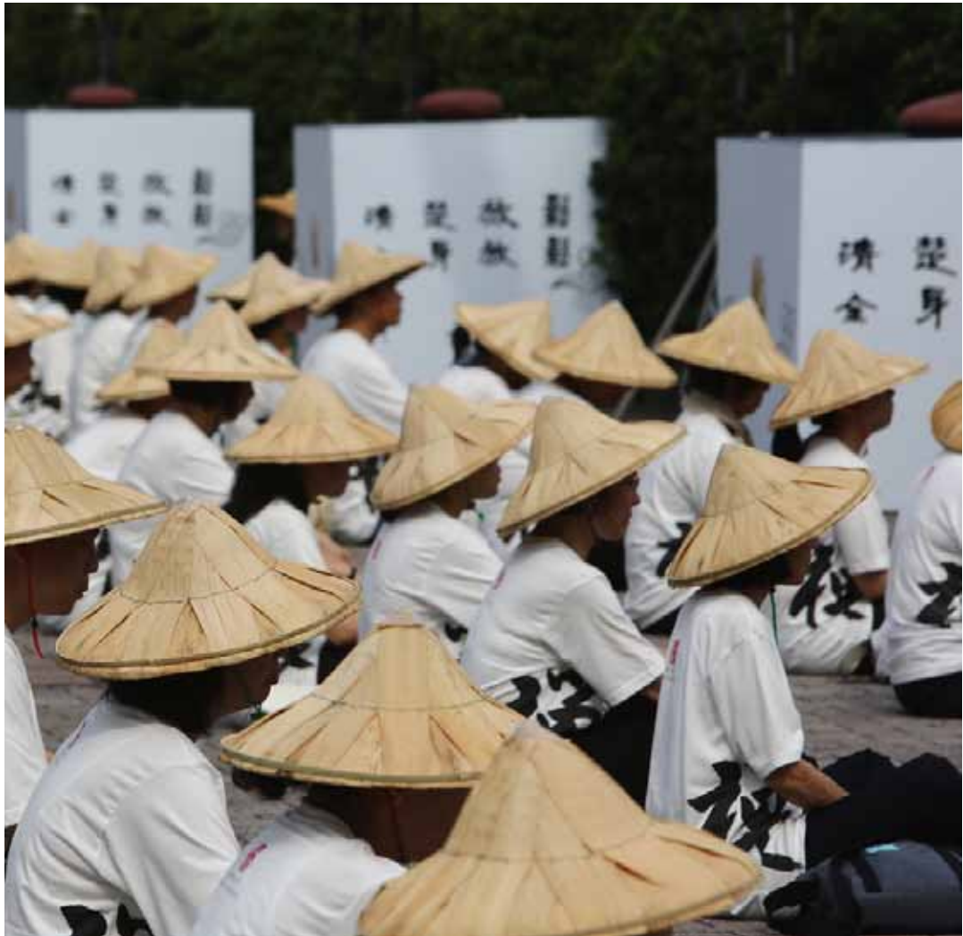
全體禪眾一同觀想佛智慧