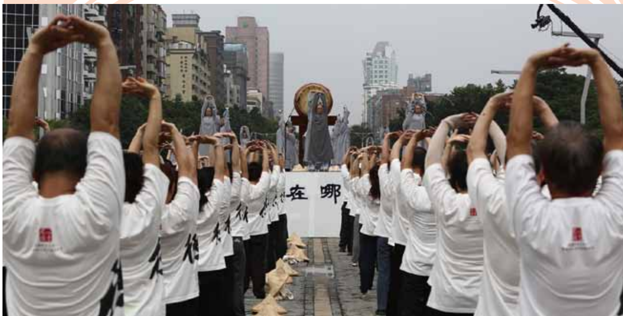
現場近萬人一起做「八式動禪」，形成一股凝聚的力量。

當現場近萬人一起禁語共修，做動禪、立禪、經行、迴向時，現場形成一股凝聚的氛圍，散發出一股安定力量，為周邊環境、整體社會注入寧靜祥和的活水。