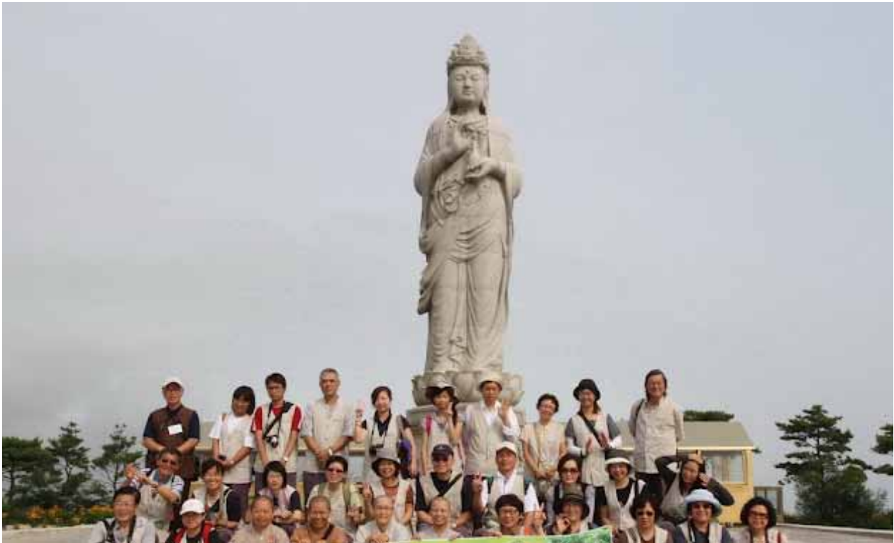
洛山寺是韓國最知名的觀音道場，也是唯一一座臨海的古剎，照片中是矗立在神仙峰上眺望東海，護佑眾生的石造海水觀音像。

者。雖然海風陣陣而來，高聳而宏偉的觀世音菩薩依然挺直地佇立著，擔任著眾生的支柱，就像〈普門品〉所言：「觀世音淨聖，於苦惱死厄，能為作依怙。」，因為海水觀音像位於山頂，這裡也是洛山寺觀看日出最好的位置。