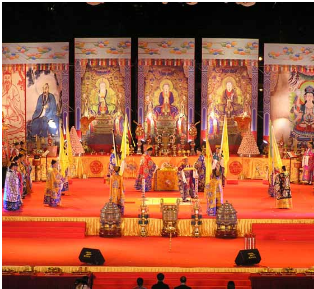
齋醮是道教儀式中重要的一環