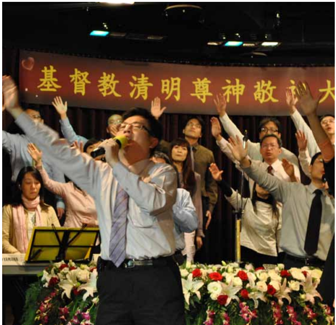
眾人一起禱告，感謝上帝賜與生命。