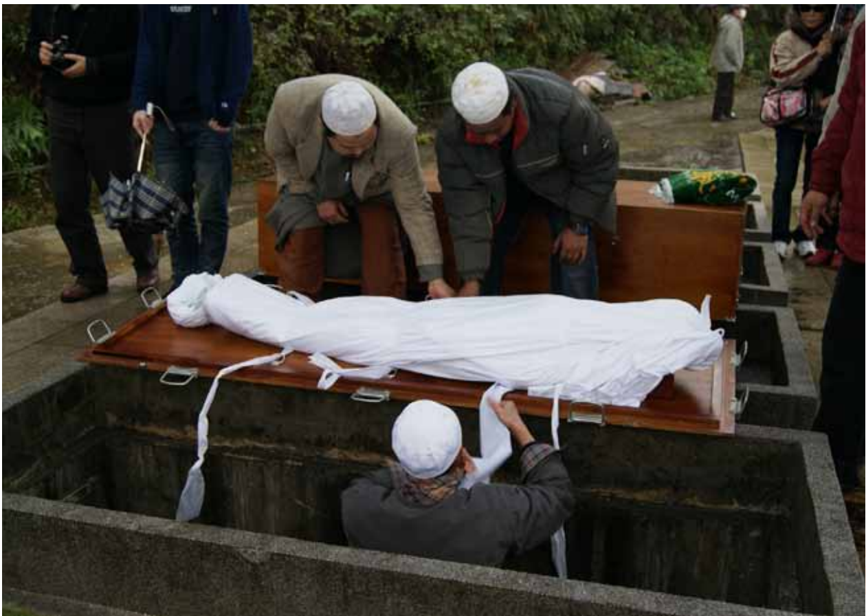
穆斯林主張與鼓勵「厚養薄葬」所以下葬的亡人沒有陪葬品、不用棺木、沒有鮮花、不貢祭品、不鞠躬、不叩頭，僅以白布包裹下葬(男女有別)。

每人死後都會被盤問這三個問題，要不三個問題都答對就是一題也答不出來，答題的結果會立刻顯現。