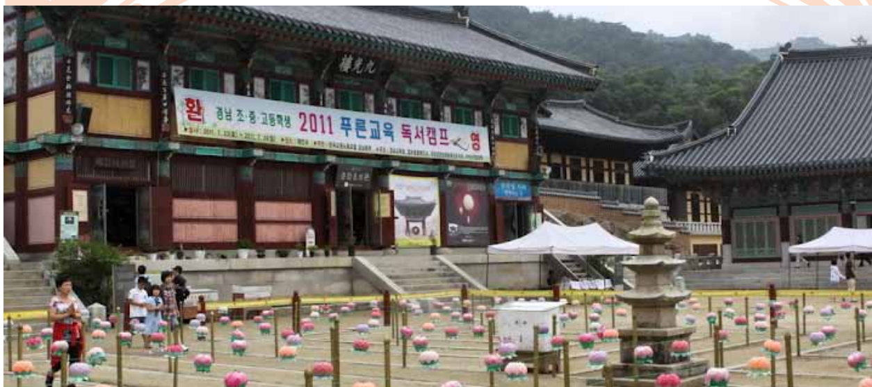
海印寺內根據華嚴法界一乘圖所設計的迷宮，讓來訪民眾透過遊戲去體驗層層無盡的華藏世界海之美。