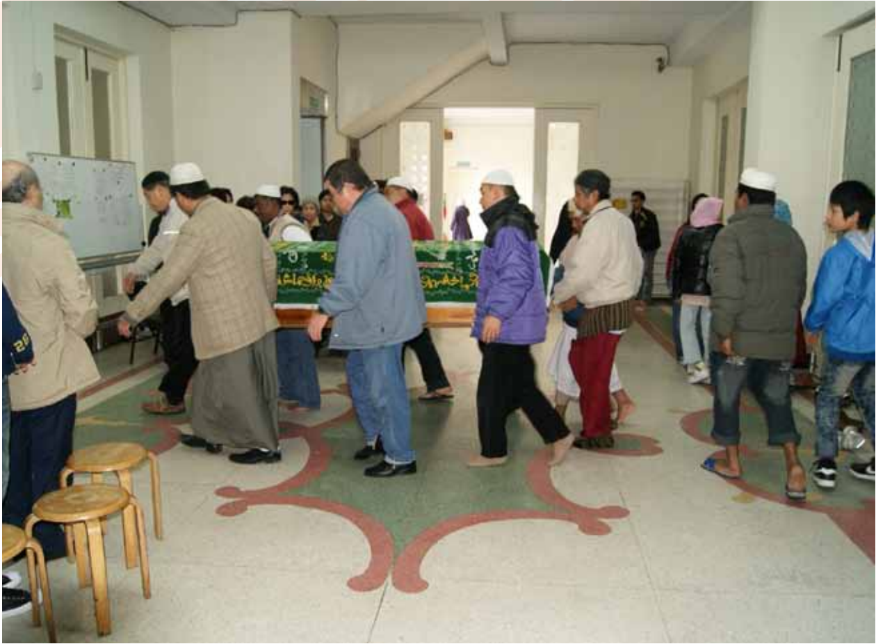
穆斯林歸真後都會被送到所在地的清真寺，由親屬或熱心教友們為他做必要的教儀式。