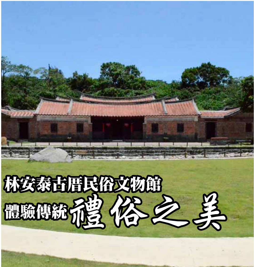
林安泰古厝是臺北市現存最具規模的閩式古宅

臺北市現存最具規模的閩式古宅—林安泰古厝民俗文物館，首度推出「傳家好禮」民俗系列活動。內容包括結合古厝建築空間與傳統生活節慶、生命禮俗的「閩南文化教學體驗」、專為小學生開辦的深度遊園課程「安泰小學堂」以及趣味十足的「民俗展演／民俗工藝教學」，讓民眾自101年4月至11月，每週都能在深具傳統建築之美的特色空間中，親身體驗民俗生活的樂趣與感動。