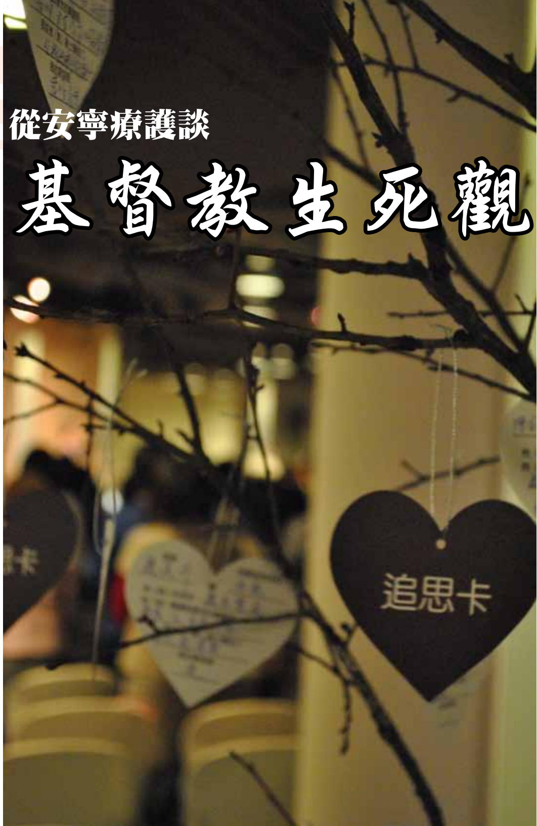
許多民眾在追思卡上寫下對親人的思念

走到生命旅程盡頭時，面對「死亡」這個關卡，「死亡」就有如一道強烈刺眼的光束直射人心，整個人就這樣赤裸而毫無遮蔽地暴露在這道強光下，所有的懼怕、無助、驚惶都再也無法隱藏，即便是多久以前就開始練習如何面對死亡，但當死亡的強光迎面照來眩亂了雙眼，一樣會墜入不知所措的深淵中。此時「信仰」所能承負的角色責任就顯得相當重要，同時它所能帶來的意義是任何科學數據都無法評量，提供的幫助更勝過任何醫療特效藥。