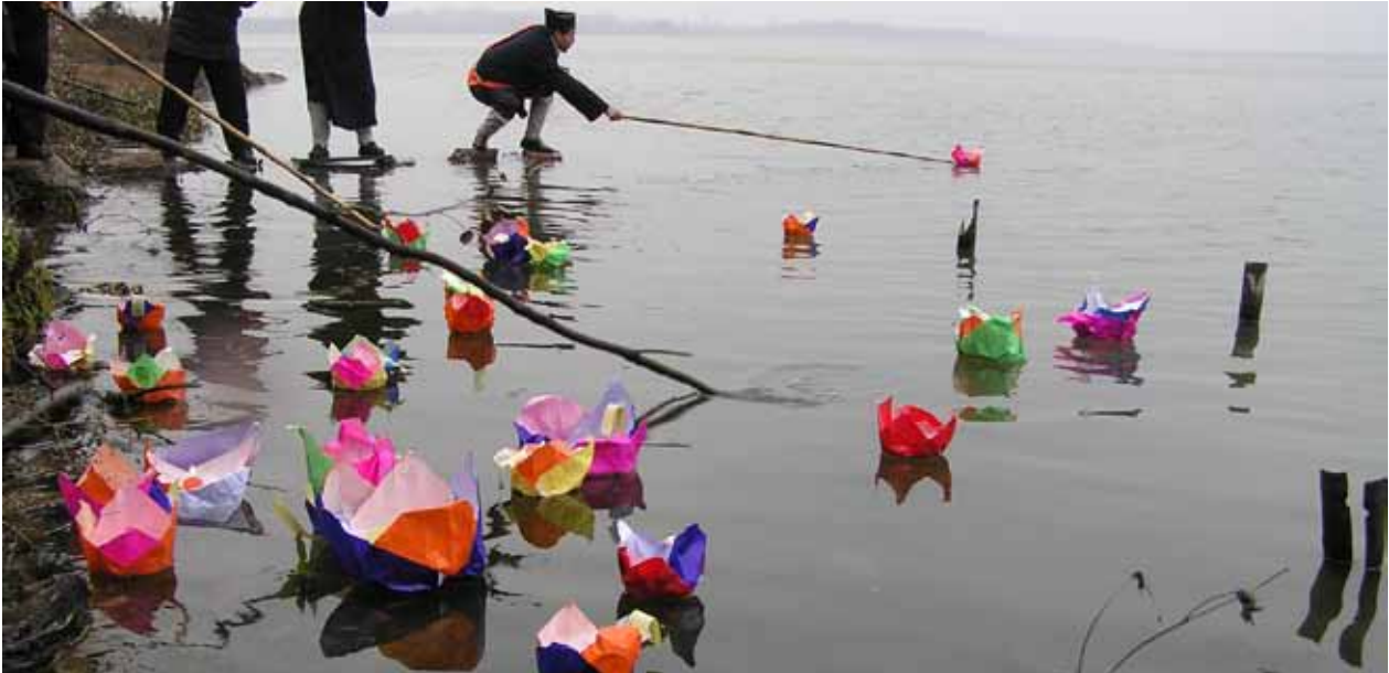
放河燈（水燈）是用以對逝去親人的悼念。

蓋了生理、心理與靈性的層面，將人融入至天地運行的自然規律中，以道的體驗來圓滿身心的存有之理。老子提出「無身」與「有身」的辯證課題，教導人們從生存的驚恐情境中解脫出來，「無身」是要有超然的生死態度，不要陷在愛欲情仇之中，不要被外在感官所誘導與奴役，迷惑於名利財色的世界，臨終時難以割捨生離死別的遺憾；臨終者若能「無身」的自覺與超拔，就能避開一般人以身視身或以心視身的執著，在身心兩忘的過程中，達到不有其身而身可有境界，以「無身」的方式來確保「有身」的常存。