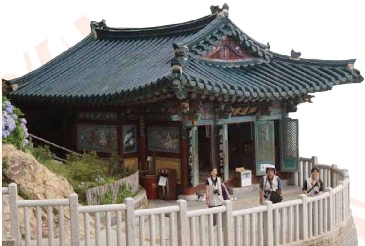
洛山之紅蓮庵，建於觀音洞上，在法堂的地板上有一個直徑10公分的透明玻璃，可看到腳下的洞窟，彷彿佛經所描述的「海潮音」。

洛山寺還有許多地方，都是江原道有名的聖地。例如在紅蓮庵旁的岩岸上有一個義湘臺，外型如中國的八角亭，據說原是義湘大師打坐修行的地方。義湘臺臨著海岸，岩石上生長著蒼勁的青松，是韓國關東八景之一。洛山寺的最高點矗立著巨型的石造「海水觀音像」，觀世音菩薩手持淨瓶，面向東海，是東海的守護