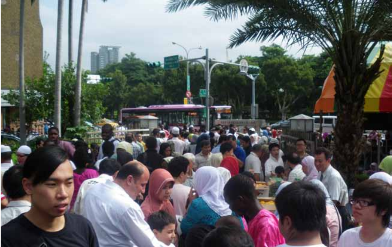
這一天就是齋戒月的結束，也是開齋節日；喜悅與祝福之情拉近了彼此的距離。

所以虔誠的穆斯林們，會在這個月裡善加利用刻苦的功修去除罪惡以求造物主的寬恕；利用自己樂施與濟貧的善功祈求造物主的慈憫給予回賜。穆斯林們都會以感謝造物主的心來看待這一個高貴的齋戒月。因為，他們可以通過接近造物主的各種功修，遠離一切有罪的、違背安拉的行為來實踐一個信念－謙卑與敬畏！