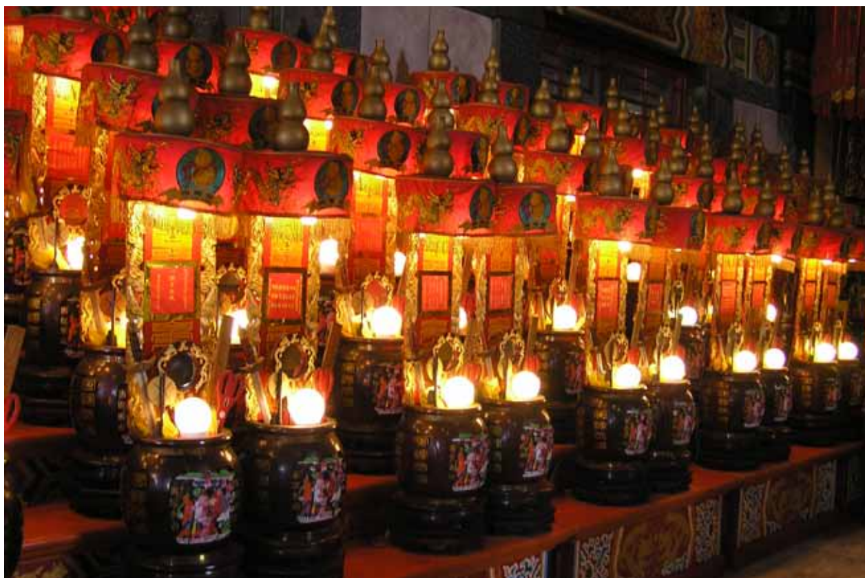
臺灣民眾習以點長命燈為家人祈福

道教是所有宗教中最重視科儀的一個宗教，在中元節時將延請道士作法事，超渡亡魂餓鬼，經由祭典與科儀使得它們能早日解脫，避免在人間作祟。在臺灣和度亡拔薦相關的法會通常有兩類，一是中元普度，二是亡者眷屬私人為亡者所舉辦的度亡儀式，法會科儀中常見破獄、施食、施醫、填還庫錢、水火煉度、度橋、升天等儀式，這些科儀遠承東晉靈寶科儀，近則延續宋代的救贖法門，南北因道派不同而有所差異，但大抵以元始天尊及太乙救苦天尊為主神，以《度人經》及太乙救苦天尊的相關經典為主。