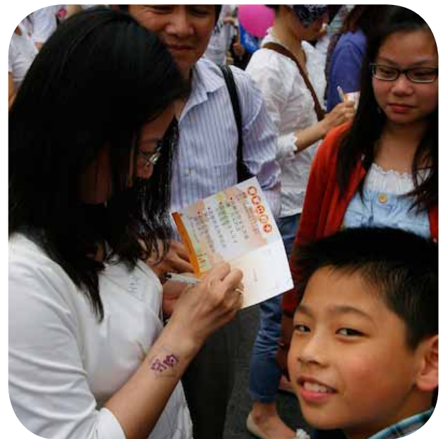
民眾簽愛家立約卡

家庭是社會的核心，重視家庭價值即是關懷社會。此次快樂義走活動，盼望透過眾人義走的方式，傳遞基督教信仰中愛家庭的美好，進而為下一代建造溫暖的家。