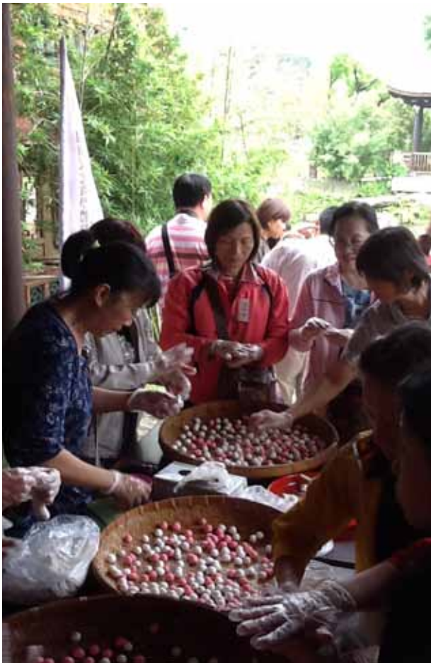
現場民眾一起體驗做湯圓

閩南文化之深耕與推廣，因此亦結合國小生命禮俗戶外教學課程，自4月20日至11月19日止，為小學生們開辦安泰小學堂，邀請國內首屈一指的閩南文化禮俗泰斗徐福全教授、福食教作達人許明焱老師，專業導賞閩式建築、庭園，寓教於樂，讓學童學習到最生動、活潑的閩南禮俗文化。