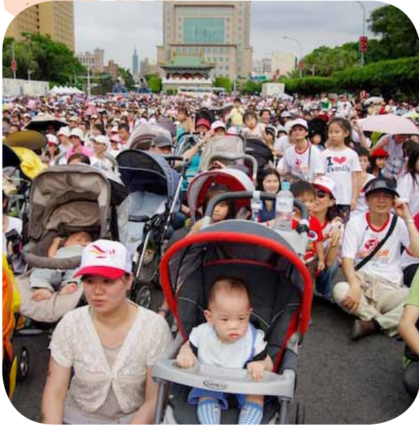
多輛娃娃車做前導，領軍義走行列