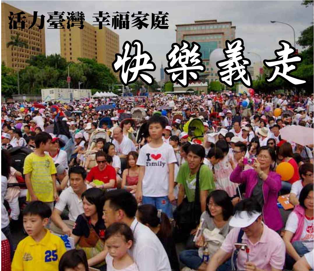
萬人響應快樂義走

為關切臺灣現今家庭狀況、高離婚率、兒虐等家庭問題，並傳遞基督信仰中「家」的美好，臺灣幸福家庭聯盟今年以「守約」為主題，與長期關懷家庭兒童議題的臺灣世界展望會於101年4月29日在全臺八縣市（臺北、新北、桃園、新竹、臺中、臺南、高雄、花蓮）一同舉辦「活力臺灣、幸福家庭、快樂義走」活動。臺灣各地萬人齊上街頭響應，宣示為幸福家庭努力，並用行动呼籲社會大眾重視家庭價值觀、關懷兒童人權。