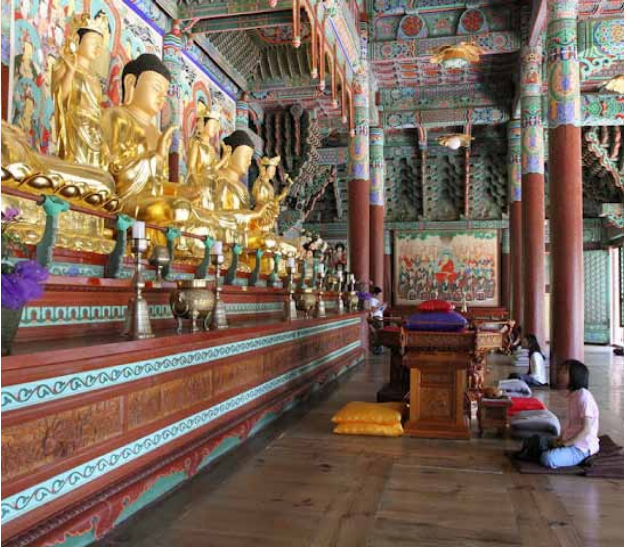
佛弟子在松廣寺大雄寶殿靜坐，安頓身心。