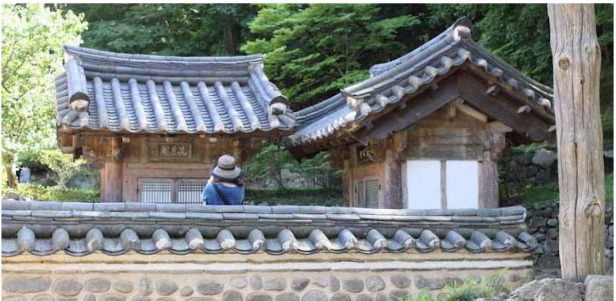
松廣寺的「滌珠閣」、「洗月閣」，是亡靈入寺前的淨身之處。