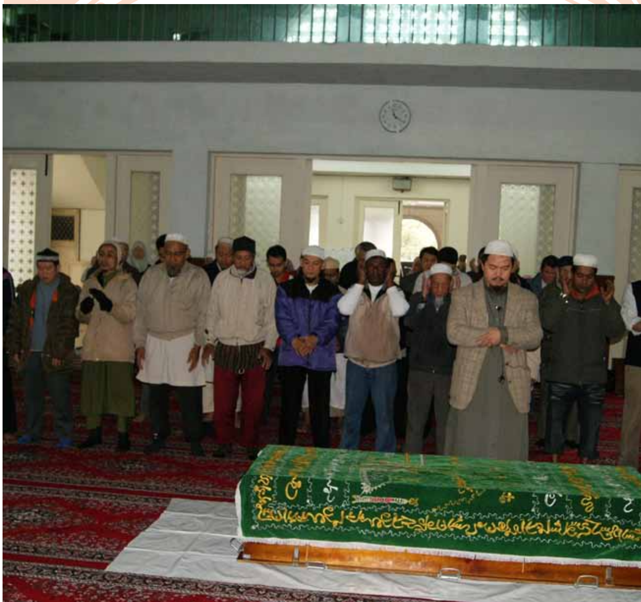
穆斯林去世一般習慣稱「歸真」，意為：我們都來自安拉(造物主)，最終也將歸於「祂」。沒有誦經，也不作法事，僅在清真寺由教長帶領教親與家屬為亡人做殯禮。

安拉在《古蘭經》告訴我們：會有一個審判日，盛大隆重、廣闊浩瀚且令人畏懼；所有被造物都會聚集在那裡，包括人類、精靈、撒旦、動物與天使，當然還有安拉－萬事萬物的造物主將是唯一的審判者。安拉在第14章第42節說：「不要以為安拉不知道你們做了什麼壞事，祂只是將報應延到那個所有人都瞠目結舌、驚恐萬分的日子。」。