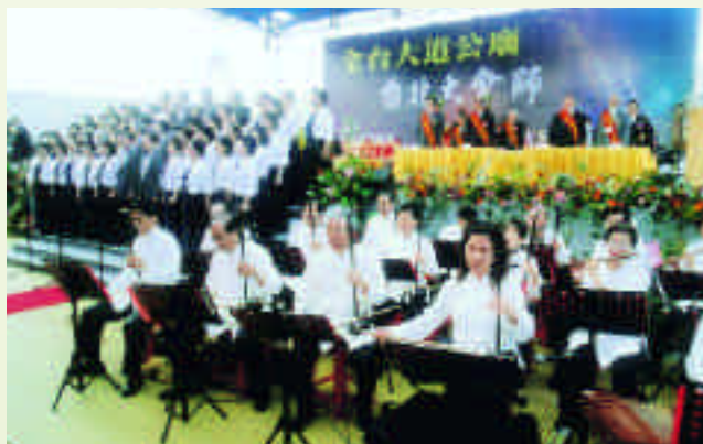
精彩的管樂隊演出

大龍峒台北保安宮，創建於清乾隆七年（西元一七四二），嘉慶十年（西元一八一五）重建，迄今兩百多年，已被政府列為二級古蹟，在清朝與艋舺的龍山寺、清水巖的祖師廟並稱臺北市三大寺廟，而近年來更在眾人的努力之下由傳統的香火寺廟傳型成文化寺廟，並在西元二〇〇三年獲聯合國教科文組織頒亞太文化資產保存獎，保安宮榮獲此項大獎，為臺灣首度獲得，在臺灣參與世界文化資產保護，具有重大意義。