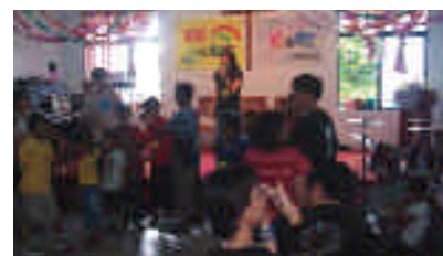
石牌信友堂青少年服務隊將滿滿的祝福和愛送到太麻里。