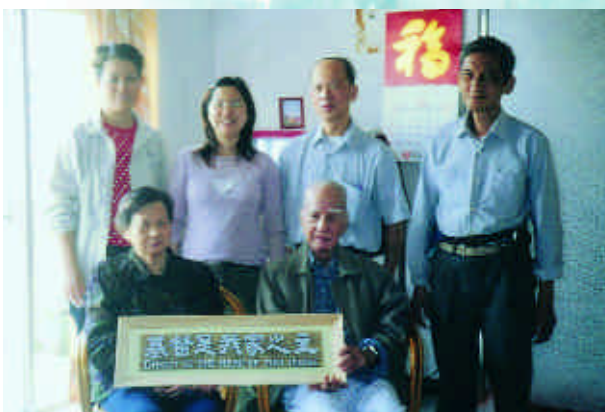
蘇牧師為楊伯伯施洗親友等都來觀禮，一同見證上帝奇妙的恩典。

說實在的，胡小姐不知道自己每週去探望這對老人家，對他們有些什麼幫助，但是有幾次因為有其他的事務耽擱，以致沒有去探望，他們便焦急地要找胡小姐，此時胡小姐才知道，上帝藉著她用詩歌及祂的話語，來安慰、鼓勵並保護這對老人家，成為他們精神上的支持。