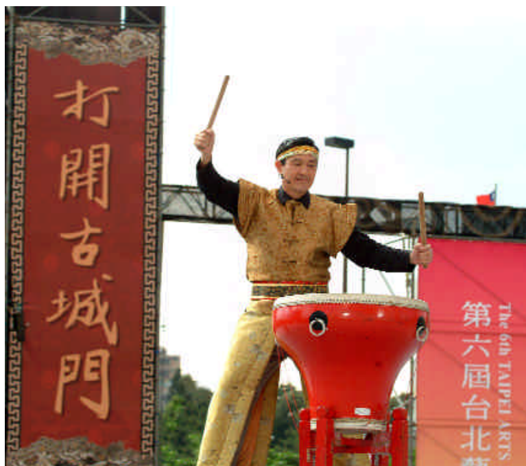
馬市長擊鼓揭開序幕

第六屆臺北藝術節於十月三日開鑼後，一連串的藝術表演陸續於臺北古城區的中山堂等藝文場所展開，並於十月二十四日辦理「劉銘傳到臺北踩街大遊行」藝文表演，其中邀請臺北市各宗教團體、社區、藝文團體，於古城區踩街遊行，展現臺北城「歷史的」、「民俗的」、「移民的」、「魔幻的」、「生活的」多元面貌，其中民俗臺北部分，邀請七座與臺北歷史開發關係密切的寺廟，恭請其主祀神明及民俗陣頭參與遊行，其中包括被稱為北臺媽祖首廟的「關渡宮」、奉祀護國開臺延平郡王