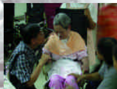
景美浸信會熱心幫助安養中心老人之情景。