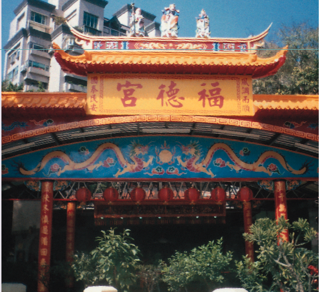
文／編輯部