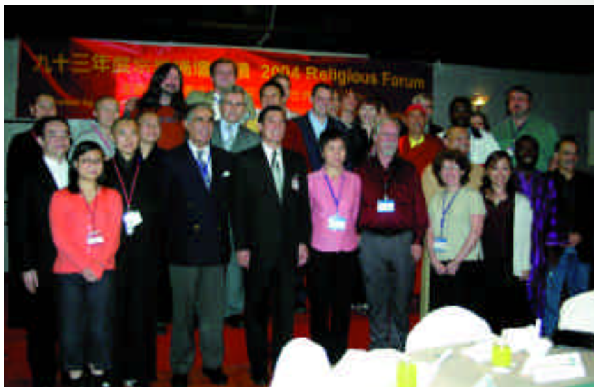
市長與參加國際會議貴賓合影

歲，出生嬰兒的死亡率更高達千分之一百三十五，瘧疾每年奪走不少人命，其中包括大人與小孩，顯示水源衛生出現警訊。柬埔寨政府為解決嚴重的缺水問題，在西元二千年時即推動一項名為「千禧年發展目標」計畫，協助民眾取得乾淨的水源，並改善水質。其中，收集雨水是重要政策之一，政府逐步幫助郊區居民安裝收集雨水設備，期望在西元二〇一七年達到百分之三十三的家庭有乾淨的水飲用，到西元二〇一五年有百分之八十的理想目標。除了協助安裝雨水收集設備外，政府更積極募款來協助社會最需要幫助的老人、行動不便及單親家庭等弱勢族群，讓他們也同享乾淨的飲用水。