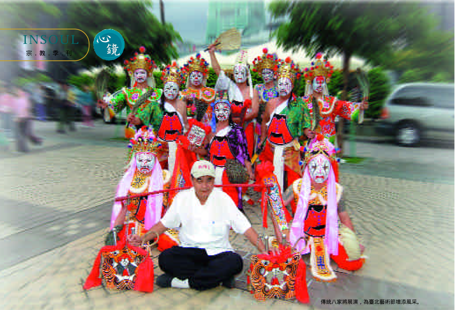
傳統八家將展演，為臺北藝術節增添風采。