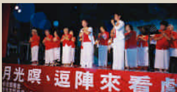
福音大戲不但帶來本土節慶的歡樂，也洗滌了觀眾的心靈。

多事情產生不滿，甚至引起怨恨藏在心裡；然而，當仇恨來到，卻只有愛才能化解，這是千古不變的道理，正如主耶穌要門徒學習「彼此相愛」並且要「愛人如己」，因為唯有愛，才能讓心靈得到真正的釋放。