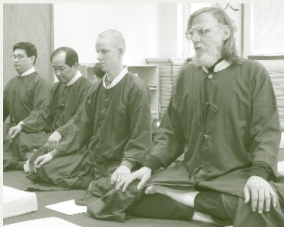
西雅圖老外學打坐

「廿字真言—忠恕廉明德，正義信忍公，博孝仁慈覺，節儉真禮和」是該教教則，信徒們以此做為「人生守則」並加以身體力行，也因此教徒的修行方式中，奉行