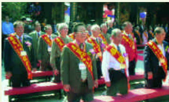
來自全國大道公廟參與盛會情景

系列活動中，保安宮安排了地方戲曲的展演，由知名的「小西園掌中劇團」與「薪傳歌仔戲劇團」於大龍街及保安宮庭院進行匯演，期待透過文化藝術的交集，讓保生大帝仁心濟世的精神有不同面向的傳承，也讓信眾重溫昔日廟埕匯演傳統戲曲的景象。