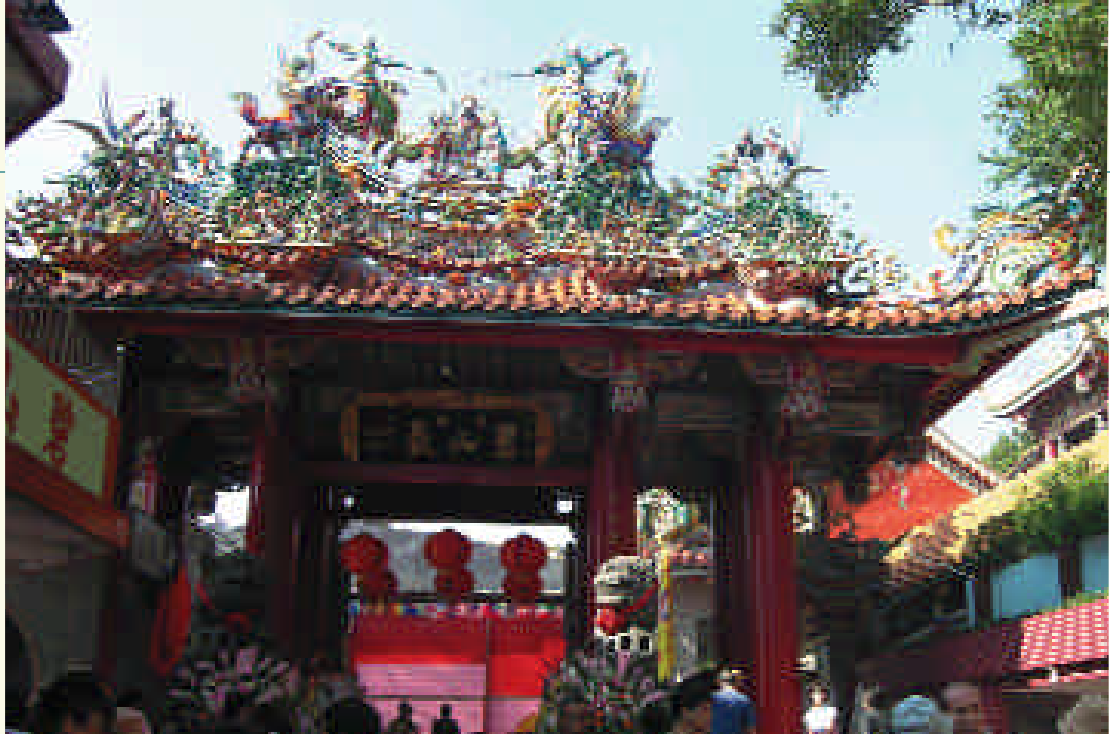
攝影 / Peter、Bill 文 / 吳冠衡、王瓊婷