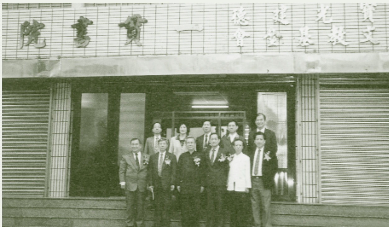
寶光建德組所創辦的「一貫書院」，力圖自我提昇。

另外有一神職人員並不負責傳道工作，但他在道場中仍有相當的地位，這一神職人員即為三才。三才是負責與上天溝通的乩