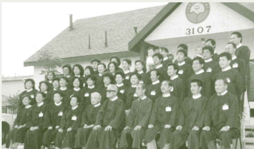
西雅圖教院靜坐班結業

天帝教雖然是在臺灣創立的，但是該教認為天帝教是「復興」而非新創，其復興的基地就是在寶島臺灣。因為舉凡目前各大宗教的聖主奉上帝之命下凡創立不同宗教之後，世人仍不顧各宗教的勸善與經典開導，