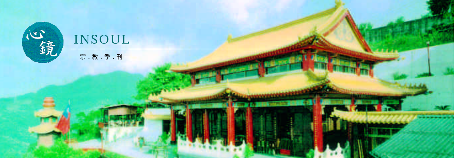
文／編輯部整理