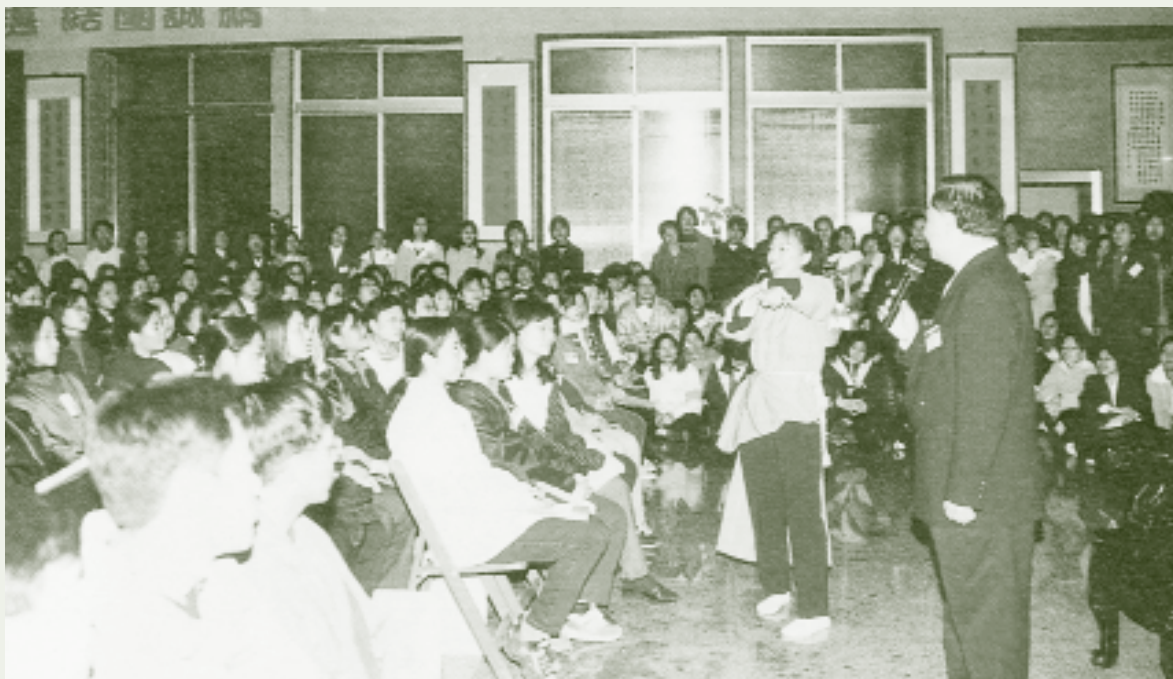
一貫道法會中的借竅儀式，圖中站立著藍衣的女子為被借竅者。

手，皆為女性，扶乩的三才通常是由幼童擔任。三才並不像其他職位，一旦選定便是一輩子的職責，而有年齡的限制，通常到了一定年齡便不再擔任乩手，而會另外賦予其他職責。