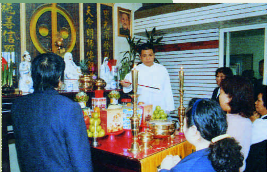
一貫道的道親求道儀式

如果您年紀稍長，可能對「鴨蛋教」的稱呼猶有記憶；如果您是大專院校的學生，您可能曾經聽過「伙食團」，甚或接觸過這樣一個學生宗教社團。因此不管是惡名或是美名，在當今的臺灣，相信您多多少少都聽過關於「一貫道」的事蹟。