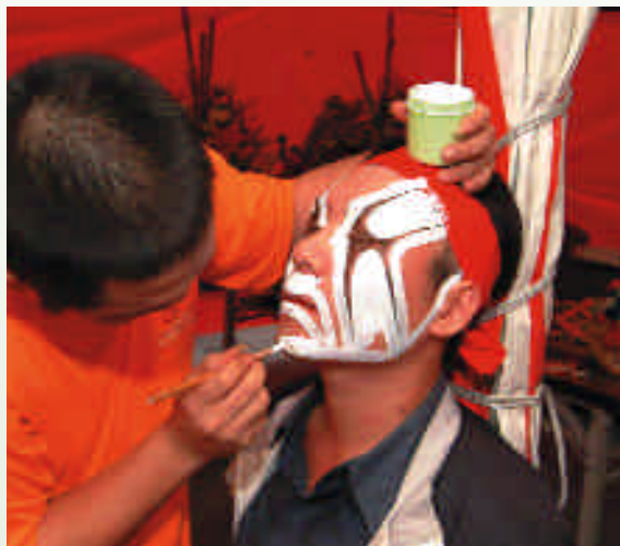
開面師父專注的為八家將開面