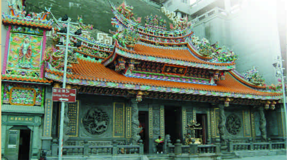
文 / 編輯部整理