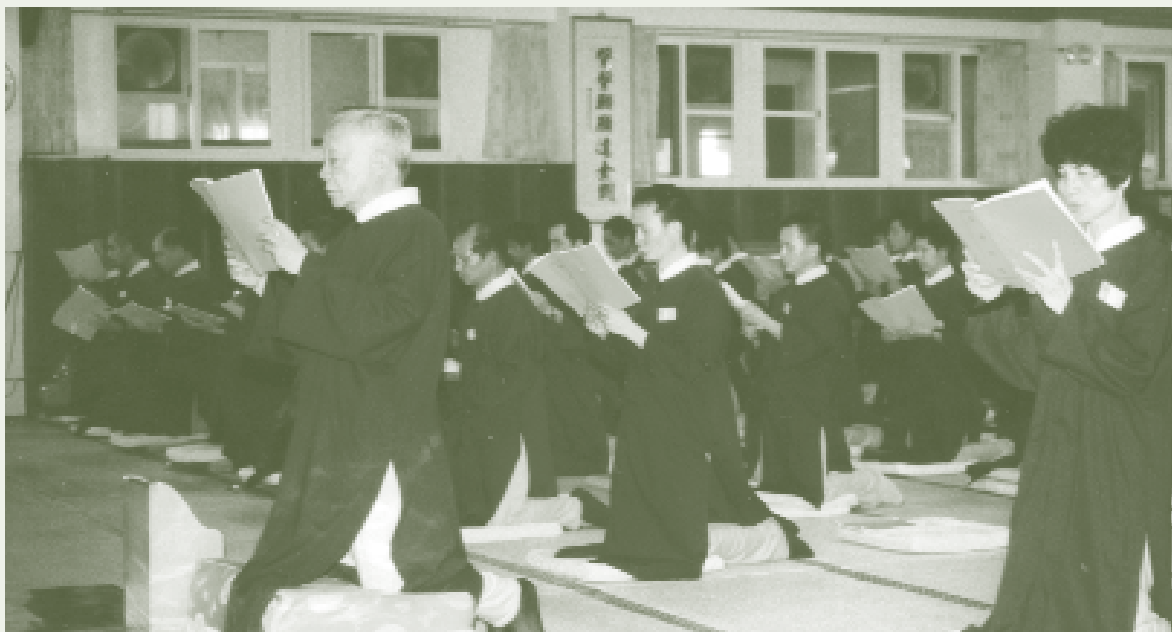
維生首席帶領誦誦

也不聽各仙佛聖神的忠告，於是暴戾之氣充塞天地，人類面臨靈肉俱焚的危機，也就是全球核戰毀滅地球的危機，此時唯有靠天帝真道重光地球，世人前途方有一線生機與和平，因此天帝教立下了：（一）「哀求 天帝化延世界核戰毀滅浩劫」、（二）「確保台灣復興基地，兩岸真正和平統一，帶來世界永久和平」這二項時代使命。