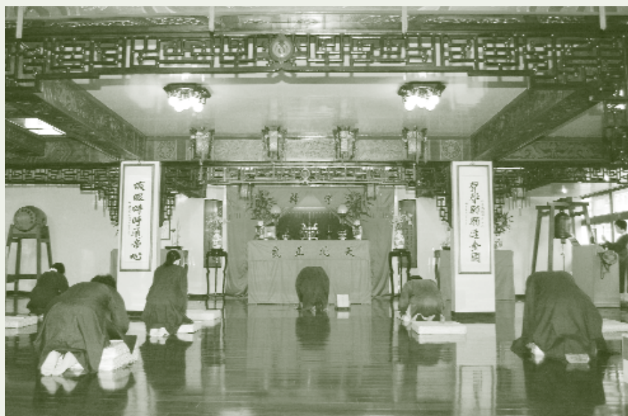
天帝教徒們每日祈禱親和及虔誦「皇誥」發揮浩然正氣來拯救天下蒼生

而哲學正思與科學驗證的正信方法，以及該組織人事與財務的公開透明，更是讓社會各界對於天帝教的「正大光明」予以高度的肯定，在這現代功利主義盛行的臺灣社會中，相信這樣一個有「情」又有「理」的宗教誕生，已經為我們的社會帶來和平、光明與希望。