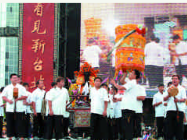
開幕式開場前禮請城隍爺舉行「淨台・祈福」儀式。

今年欣逢臺北建城一百二十週年，臺北市政府從今年春末起，藉由各局處輪流舉辦相關紀念活動，不論是現代或傳統的藝文表演、靜態展出或動態參與的市民嘉年華、亦是未來展望或歷史懷想的各類紀念活動，都讓臺北城的市民或來自國外的賓客，透過活動的參與及歷史的回想，體驗這個城市的全「心」感受。