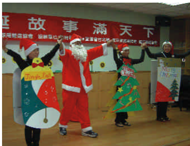
南京東路禮拜堂在中正國小聖誕故事演出

騰」、「平安夜」、「彌賽亞」、「啊 聖善夜」、「天使初報聖誕佳音」等多首詩歌。因為教會聚會方式的改變，傳統詩班僅在部份的教會中仍然存在，許多教會已由打擊樂器的方式，或臨時編組集訓的詩班代替傳統的詩班。