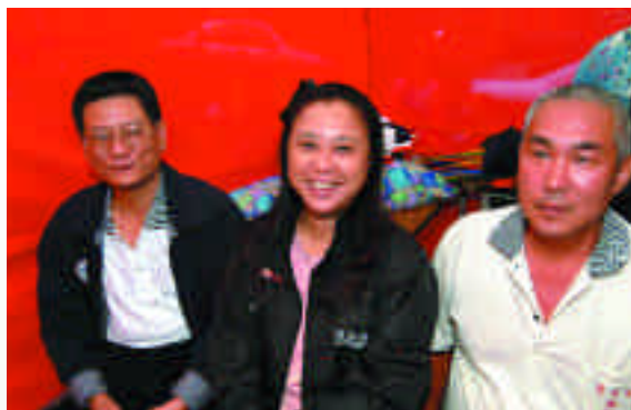
台北霞海城隍廟特請「振祐堂八家將團」來參與盛會。

當天民俗藝陣的展演雖為下午方才進行，但整個籌備工作從清晨即已展開。為展現傳統民間宗教藝術的莊嚴之美，一大早就在台北霞海城隍廟前先為八家將進行「開面」儀式，此儀式是於扮演家將的人臉上，畫上代表神明的臉譜，並進行入神科儀。民間宗教相信