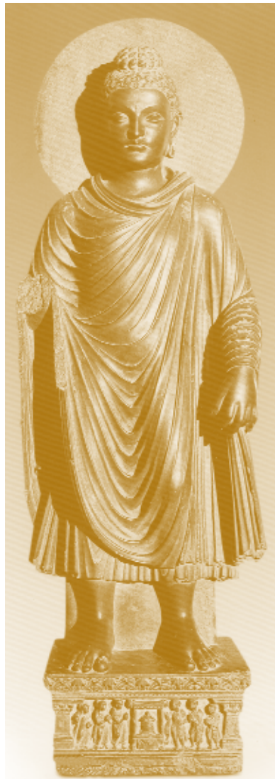
佛立像犍陀羅時代（西元二 五世紀）

乘佛教信仰的關係，開始有了下一個佛將出現的預言，有就是彌勒菩薩的出現。一般我們認識的彌勒菩薩，是個肚子圓滾的胖和尚，通常當作福氣財神來供奉，那也就是明代發展出來的布袋和尚像。不過印