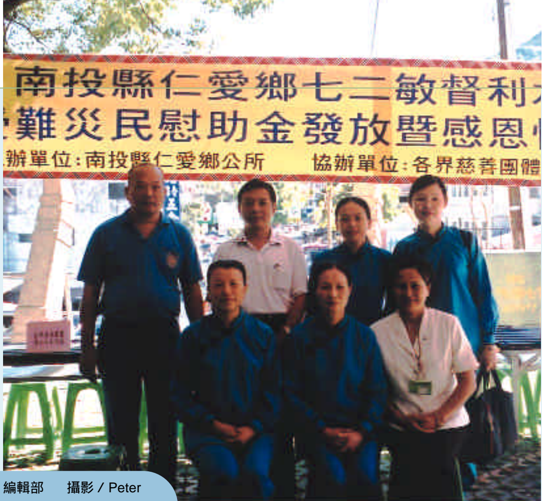
文 / 編輯部