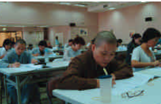
學員認真上課的情形

九十三年度宗教財務研習課程，於七月二十三日圓滿結束，學員們除了感謝民政局用心的規畫也希望往後能夠繼續開辦宗教團體相關的研習課程，相信在主管機關與宗教團體的良好互動下，必能為宗教業務輔導與推動累積良好的成果。