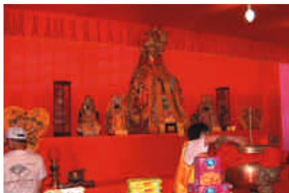
金面媽祖安座於二二八紀念公園供民眾焚香祈願。