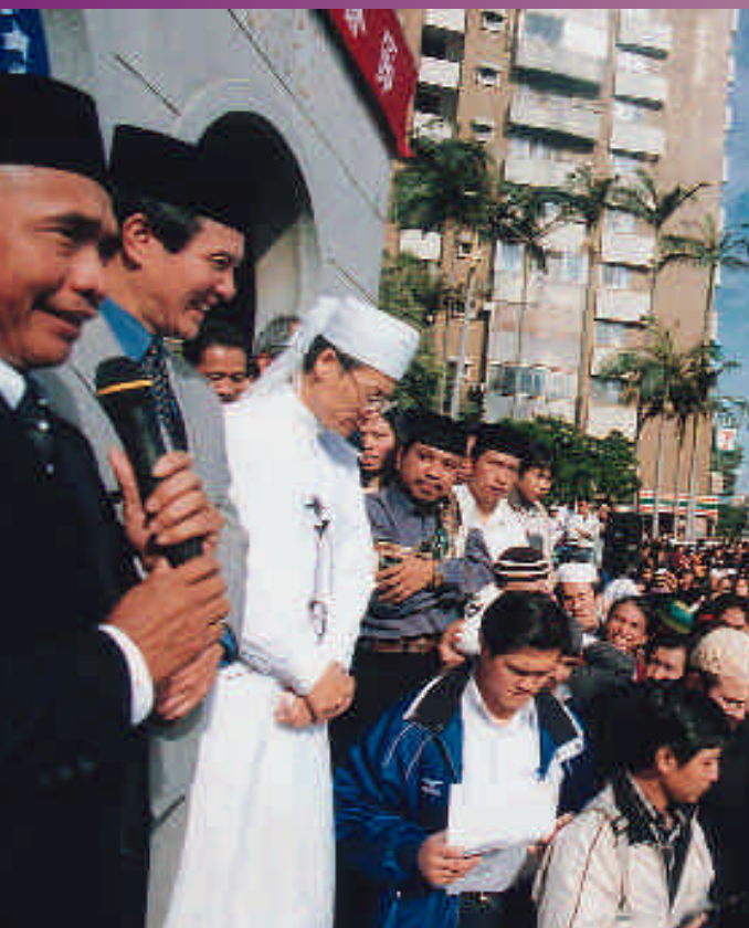
馬英九市長參加伊斯蘭開齋節會禮受到信徒們的歡迎