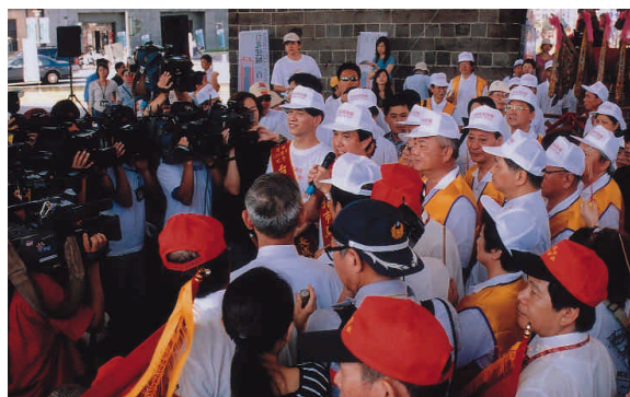
北城門前市府團隊及眾人一大早就開始準備迎接媽祖聖駕。

陣頭一路行至終點二二八紀念公園，由馬市長主持安座儀式，致詞中表示金面媽祖是第一位由城門入城的神祇，市長除了歡迎金面媽祖回娘家外，也祝禱國家政通人和、大家平安喜樂，同時對於參與本次活動的宗教團體並表示由衷的感謝，馬市長溫馨簡要的致詞內容獲得現場與會宗教團體與民眾的熱烈掌聲。