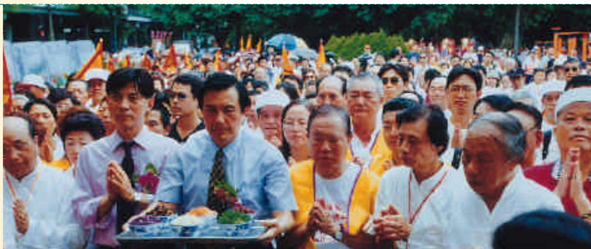
媽祖安座時，主祭官馬市長行敬獻禮。