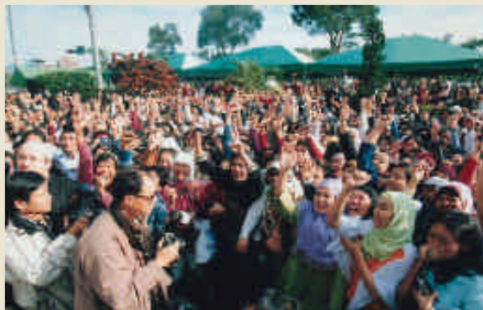
開齋節會禮現場實況