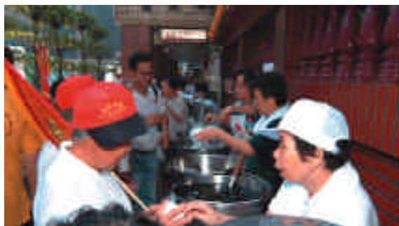
省城隍廟的義工們忙著分發冰品給信眾。

隨媽祖回娘家遶境的香客中，不乏年紀老邁的長者，雖然年歲大了，但是每個人臉上總是帶著一付歡喜、虔誠的模樣，其中有一對八十幾歲的阿嬤姐妹由三芝互相攙扶相隨至臺北，問她們旅途累不累？阿嬤露出了十八歲般的天真笑容說：「跟媽祖一起出遊真是福氣啦！怎麼會累呢！」說著說著又趕緊跟上陣頭，追隨媽祖去了。望著阿嬤沒入人群的可愛背影，讓人看到了只要用心，滿足與喜樂原來是這麼垂手可得。