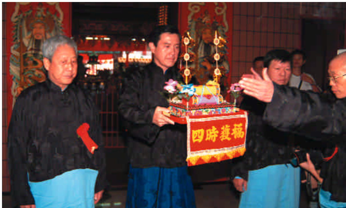
城隍大三獻禮儀典莊嚴、隆重。

城隍爺在臺灣早期為官方祭拜的主要神祇，地方官每月初一、十五都會至城隍廟祭拜，祈求城隍爺庇佑地方治安平靜、百姓安居樂業。