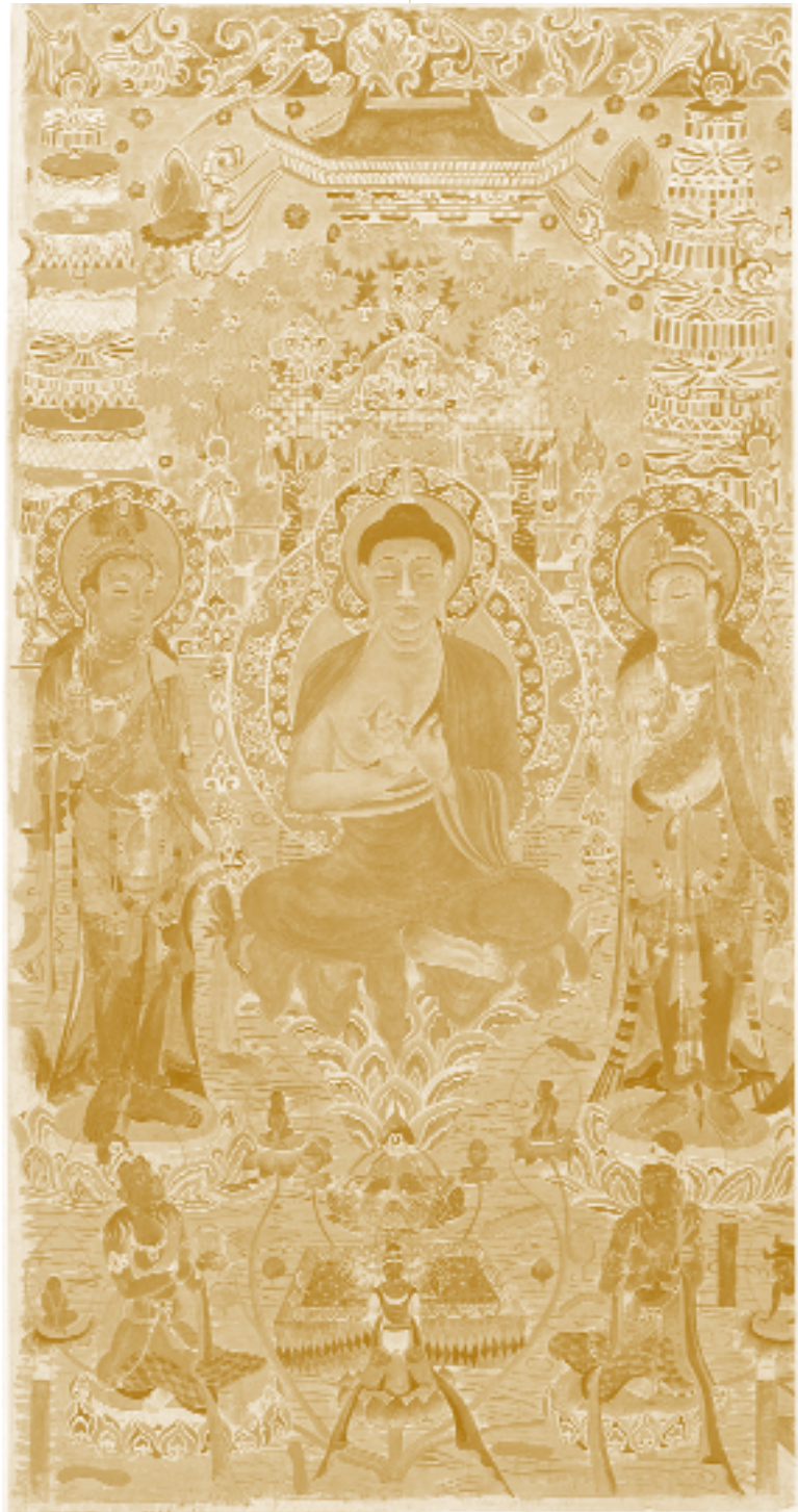
西方淨土變局部 - 蓮池說法

從上述介紹從印度、中國、日本等地的佛教藝術，可以發現亞洲佛教藝術的各有其精彩之處，不但是民眾信仰的內容，也更是人類共有的文化瑰寶，不論在文化、信仰、藝術角度都值得大家細細品味與探索。（本文作者現任華梵大學講師）