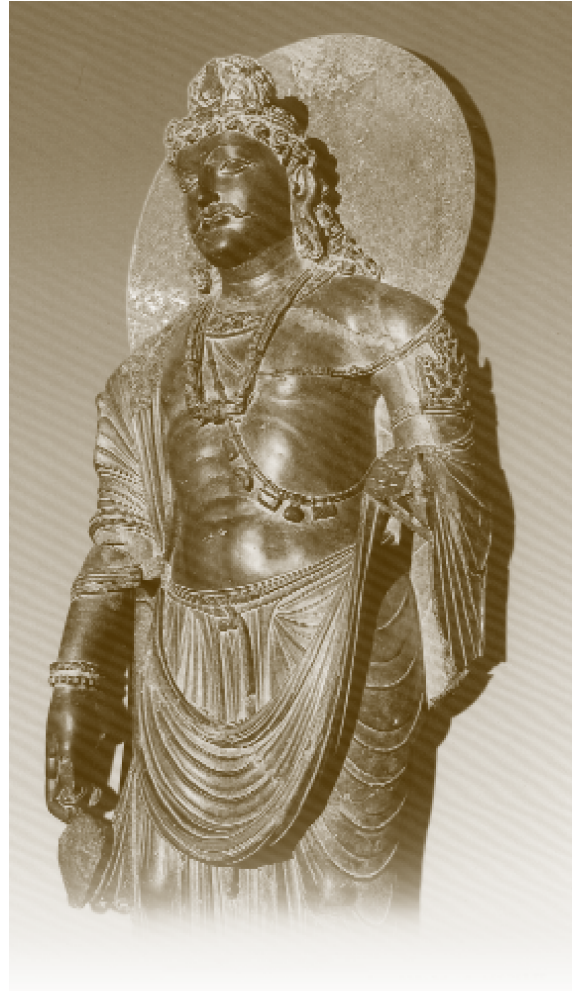
彌勒菩薩立像健陀羅時代 (西元二 五世紀)

塔上，保存了佛教最早的雕刻，時間大約是西元前一世紀前。佛塔的四方有四座石雕的山門，形式就如我們在日本所看的鳥居，也可知道佛教建築形式流傳在亞洲地區。桑淇佛塔的山門上面布滿了雕刻，被視為早期佛教藝術的代表，當然也是認識印度藝術的源頭。