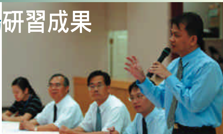
專業會計師現場講解的情形

臺北市政府民政局掌理臺北市宗教輔導業務，對於這些以淨化社會心靈及濟世救人為主要成立宗旨的團體，莫不抱持尊敬的服務態度，在業務上給予適切的輔導，希望藉由良好的互動，促進宗教團體的社會功能。