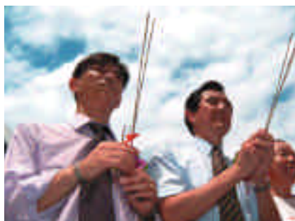
扶鑾隊伍緩步前進，接受沿途民眾焚香祈願。