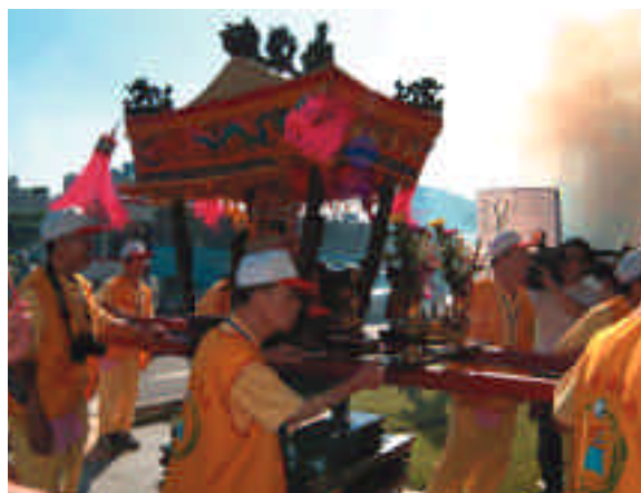
北城門前熱鬧的迎駕隊伍