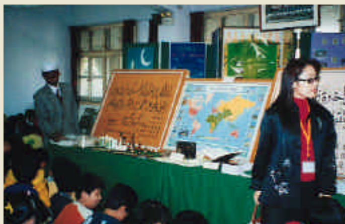
開齋節園遊活動現場