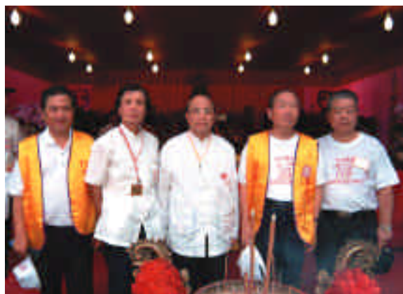
大力協助迎媽祖回臺北城活動之宗教團體留影。