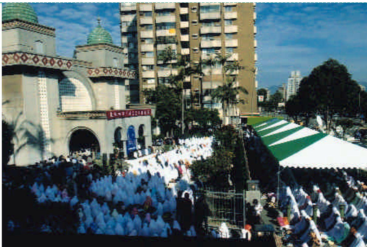
每年伊斯蘭開齋節吸引大批信徒聚集台北清真寺參加會禮