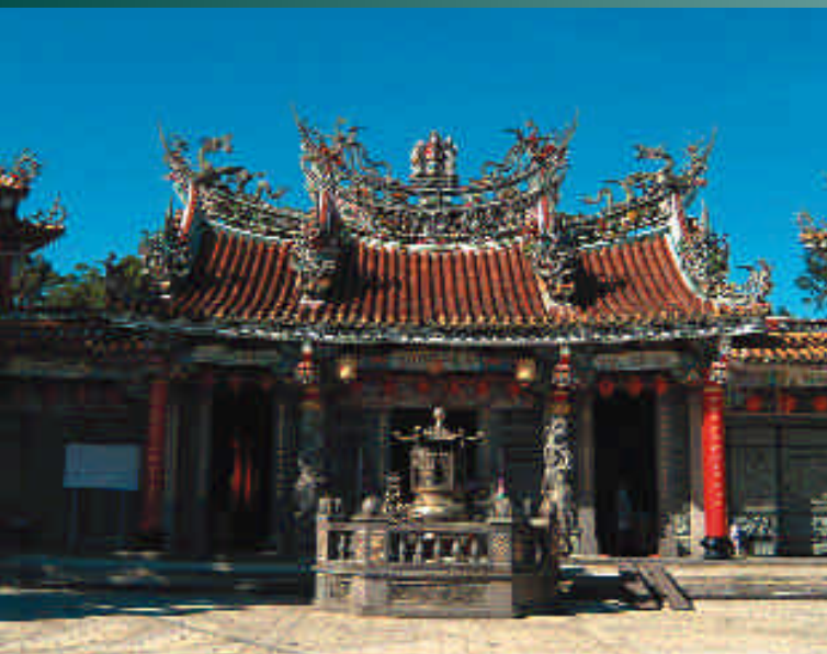
芝山巖惠濟宮外觀

每年到了中元期間也就是農曆七月，士林、北投地區包括現在的士林、石牌、陽明山、三芝蘭等號稱四角頭的聚落，均會輪流舉辦芝山巖的中元普度，這項由各角頭輪番值普的普度文化流傳已有約一百五十年之久，深刻而緊密的維繫區域居民的情感，透過世代傳承，每年的普度活動儼然已成為四角頭居民生活的一部分。