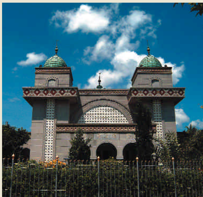
台北清真寺