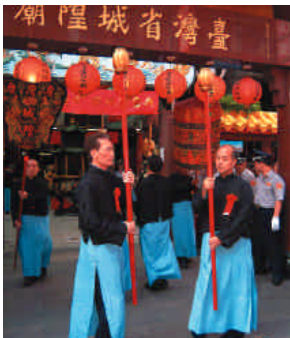
擔任省城隍大三獻禮祀典的通贊官、禮生均為一時之選。

據詹董事表示，省城隍廟的源起，可追溯至西元一八七五年，當時臺北設府，主要管轄範圍包括新竹、淡水、宜蘭三縣，臺北衙於西元一八八一年在撫臺街後方，也就是現在的延平南路與漢口街附近的台糖公司右方，建造了一座城隍廟，主要供奉台北府、縣二城隍，西元一八八七年臺灣建省並將臨時省會設於臺北城，而這座城隍廟到了西元一九四五年台灣光復後，才正式改名為臺灣省城隍廟。