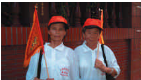
從三芝來的阿嬤姐妹，滿心歡喜的隨香至臺北。