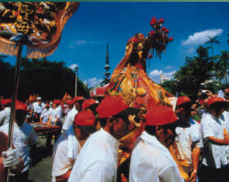
迎接金面二媽回臺北城盛況

臺北市馬英九市長以及民政局長也特別參加這次迎媽祖的盛大宗教活動，從一大早在臺北城門列隊迎駕到扶鑾、安座均全程參與，看到馬市長及各首長汗水淋漓的虔誠模樣，相信媽祖一定也會保佑市長最愛的臺北市民全部都平安健康、事事順利。