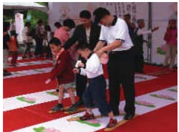
▲ 展現親子互動的七步蓮花步道，讓親子共同走出趣味蓮花傳奇。

主辦單位法鼓山安和分院表示，這場感恩會並非一般的傳統浴佛活動，而是藉由歡慶佛誕的過程，提供一個親子互動、母子同樂的機會，為人子女者都能在陪伴媽媽參加活動的過程中，虔心為母親祈福，並表達對母親養育的感恩！主辦單位期許民眾在許願、祈福與感恩中，找到和敬平安與幸福。