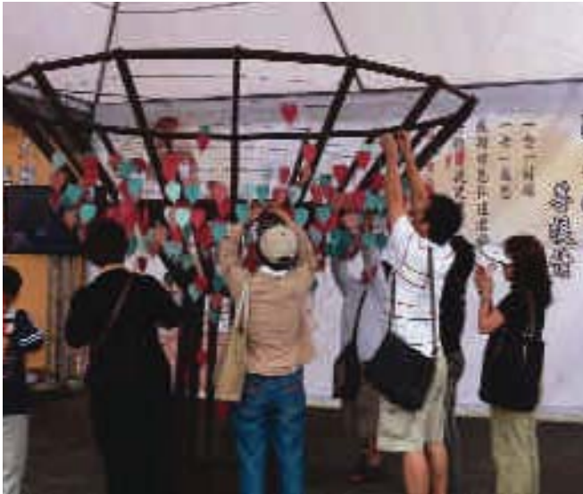
▲ 現場民眾寫下祈福心願高掛於祈願樹上

有機會沐浴佛法。因此為人子女要在今天這個特別的日子裡向父母祈願感恩，並依循佛陀的開示，過著自利而利人的生活。聖嚴法師簡潔的開示，讓與會人士如沐春風。臺北市政府民政局葉副局長傑生當日亦應邀參加盛會，在致詞時，特別代表臺北市政府祝福媽媽們母親節愉快，並祝福天下的媽媽們都能在浴佛典禮中同霑法喜。葉副局長於開幕式結束後與市民朋友們共同參與各攤位的遊戲，共享佛法喜樂。