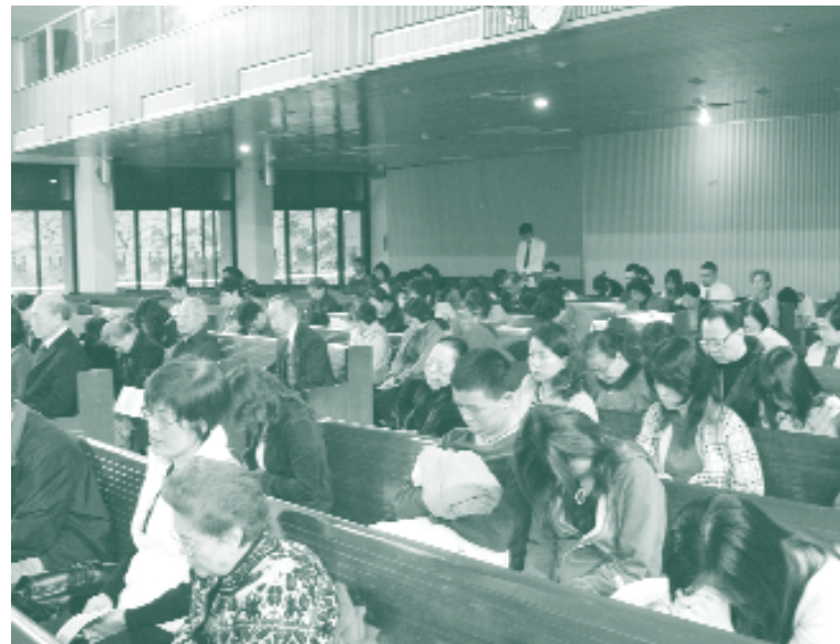
▲ 教徒們藉由禱告之儀式與上帝溝通得到心靈之慰藉

「你吃了，當天一定死亡」，這是上帝命令人的時候所說的話。亞當、夏娃吃禁果的那天死了嗎？從生物性生命的觀點，很顯然地，他們沒死，他們還活很久很久之後才死。不過，墮落故事中的亞當和夏娃在吃了禁果之後，跟上帝的關係不一樣了。他們害怕見上帝（創世紀第三章第 8-10 節），意即他們跟上帝的關係被破壞了、斷絕了。倘若生命不只意指生物性生命，也是指人跟上帝的關係——靈性的生命，那麼，亞當、夏娃吃禁果的那天真的死了。他們的肉體——生物性生