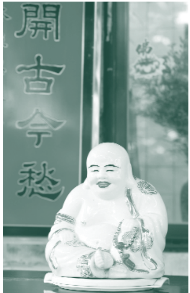
▲ 彌勒佛滿臉笑容，雙耳垂肩及肚大能容的形象，已成為最具有民俗文化象徵的代表人物。

彌勒佛本是佛教信仰裡的救世主，他和觀世音、文殊、普賢合稱四大菩薩。佛典中曾記載他的偈語：「我有一布袋，虛